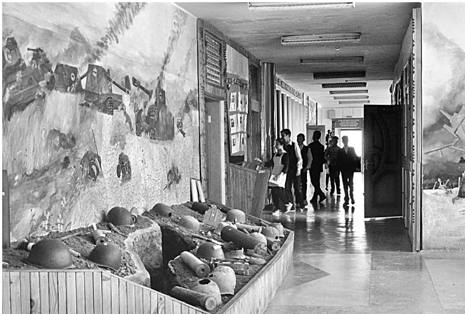
Школьный музей Великой Отчужденной войны