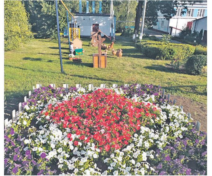
Старобезгинская школа Новооскольского городского округа