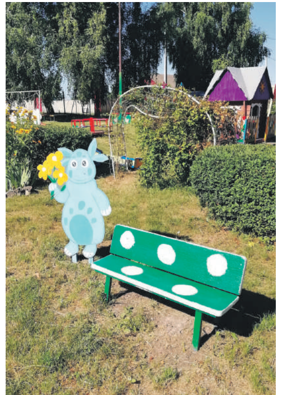
Детсад № 4 с. Алексеевка Корочанского района