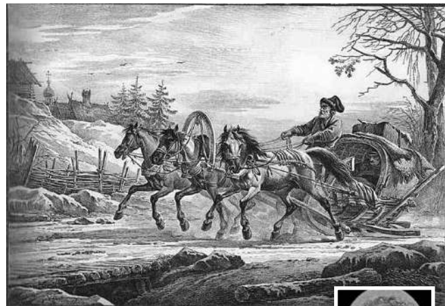
Настоящая кибитка — это крытая повозка, как на этой литографии Александра Орловского «Путешественник в кибитке, или Сани, запряжённые тройкой» (1819, Киевская картинная галерея)

Другие ученики назвали кибитку «птичкой», летящей с Кубы и крыльями поднимающей снег; «поездом, который очень быстро едет, и поэтому снег летит вверх и вниз» и даже «кибернетической, шустрой тёткой». Ямщик, по их мнению, оказался «дядей, профессия которого — таскать ящики»; человеком, роющим ямы, вероятно, карликом, «потому что сидит на чём-то маленьком и прячется в ямку».