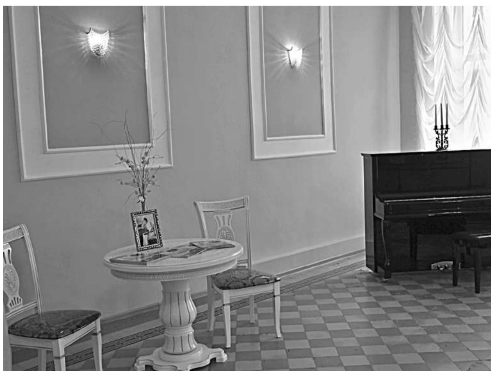
Ольгинский зал школы № 1