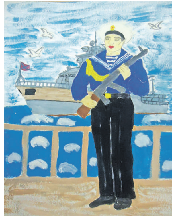
Моряк. Рисунок Анатолия Черняева (Графовская школа Шебекинского горокруга)

Ульяна Самаль, ученица Бессоновской школы Белгородского района