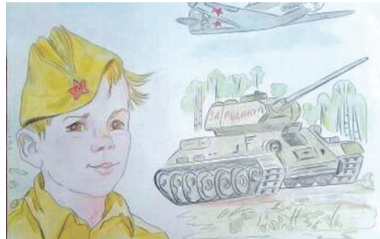
Рисунок Дарьи Лопиной (Корочанская школа им. Д. Кромского)