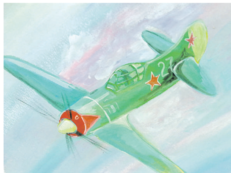
Воздушный бой. Рисунок Дмитрия Новикова (Корочанская школа им. Д. Кромского)